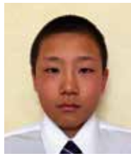
佐久市立高瀬小学校6年生

「競技会において優秀なる成績を収めたもの（具体的には、「全国競技会（国体を含む）」において入賞したものと及び5年以上にわたり出場したもの」及び「国際的競技会等において他の模範となるもの」に与えられる賞です。