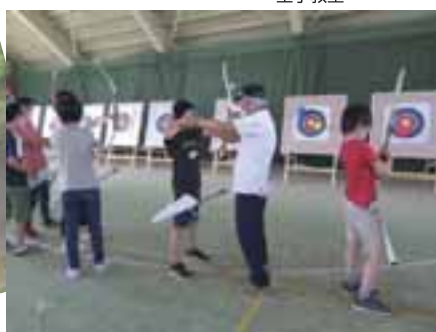
アーチェリー教室