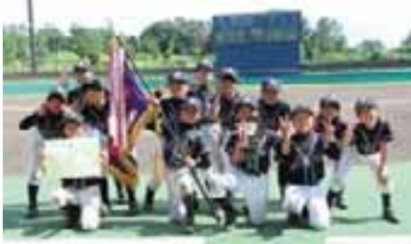
●Bブロック 優勝 相生町 準優勝 安原うすだ 3位