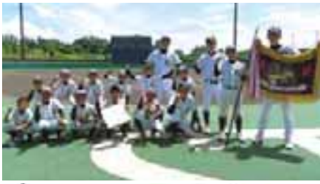
●Aブロック 優勝 泉長土呂A 準優勝 新子田 3位

新型コロナウイルス感染症、熱中症対策に対し、参加者、保護者、チームスタッフ、審判員の皆さんに協力いただきありがとうございました。