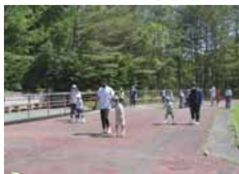
スピードスケートローラー教室