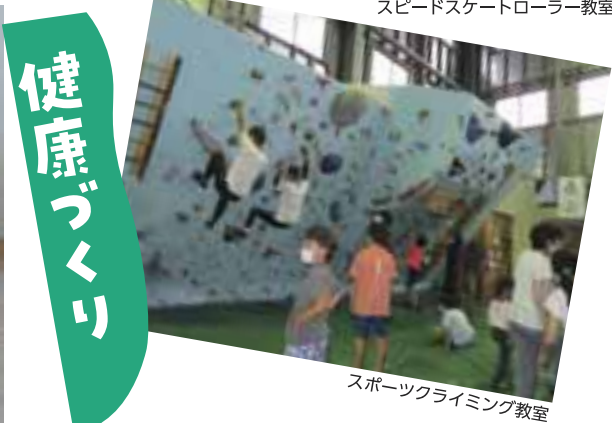
スポーツクライミング教室