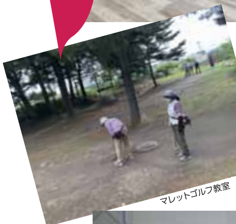
マレットゴルフ教室