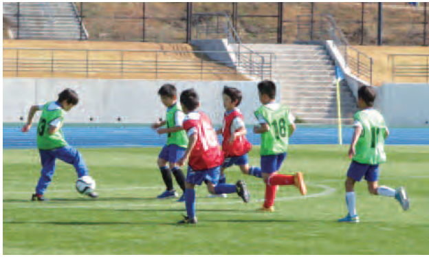
を待ちしております。